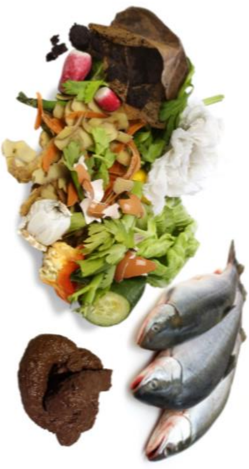
Døde dyr, madrester og hundelorte