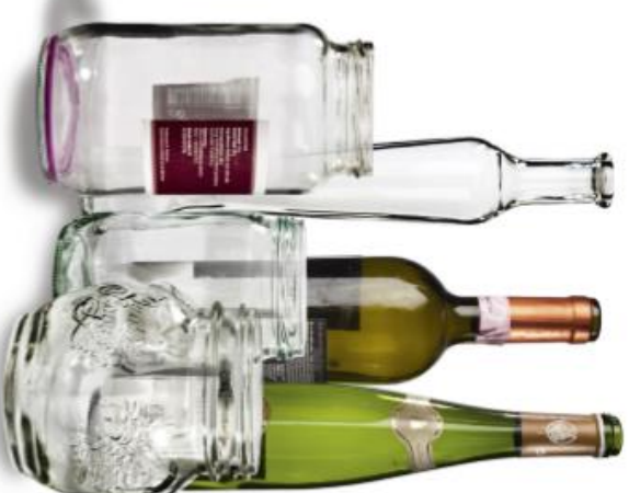
Flasker og glas