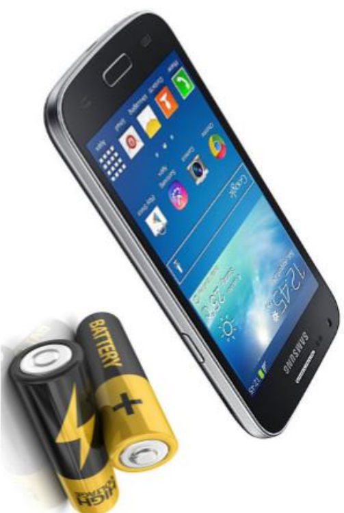
Tabte mobiltelefoner og batterier